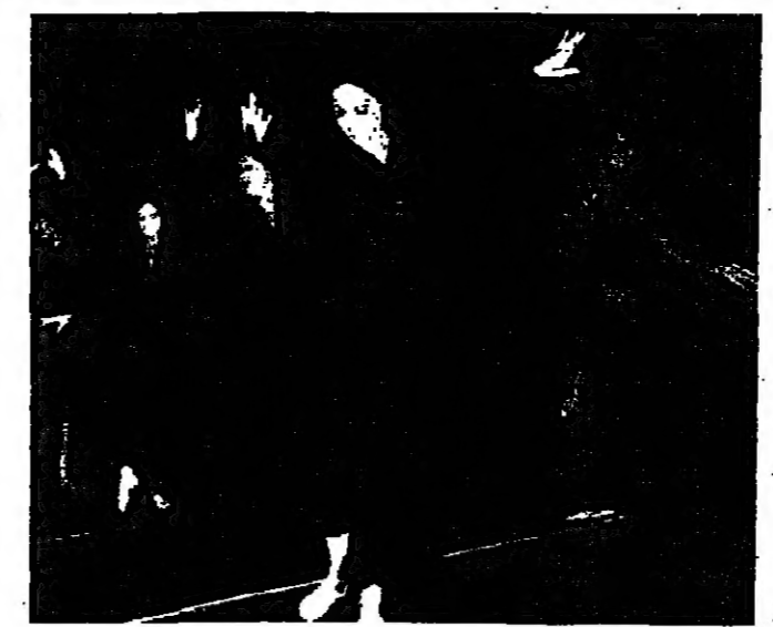
الجرع عيب في فرقة «ان بيرنجيه»

وياح كل واحد منا عن اعياهه للاخر. جاز صوت تيودوراكيس ليقول لنا ليس ثمة فرار من الدائرة التي اسرنا انفسا فيها، ليس ثمة فرار من دائرة القار، وكالت قصة هذا الفصل الاخير تكيدا ان الفرار ممكن حتى داخل الاسوار وحقل اسوار اثار ذاتها. اسم الرقصة الثابتة كان اتفوق. المرأة التي رفضت واخضعت وتبرعت وحزت وخلفت الاوسر والتقاليد هي يد الموت. تميز تقاليد واعرافنا وتلقاها جيدا. انها المرأة التي حاصرنا الاسوار حتى الموت، واذا هي الفرار كله لصل لنا وتقسما بشينا رغم مسافة هذه السنين. لم يقل لك صوت تيودوراكيس ولا مويستا بل كانه الجسد. هذا السجن الهائل يخضع القلب ومهيمت الروح. هذا السجن الذي لسارونا التي ان نستطيع ان نوح بها. قاله لنا هؤلاء الراقصون غسي قترهم وسفرهم وتجليهم على خشبة المسرح في هذا الليل. ما اصعب الصمت وما اشده وغشا حين ينطق، اسود نطق بواسطة الكلمة التي كانت في البدء او الجسد الذي كان اول الخارجين من الجنة.